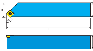
本圖所示為右手刀 (R) Right-Hand Show