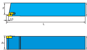
本圖所示為右手刀 (R) Right-Hand Show