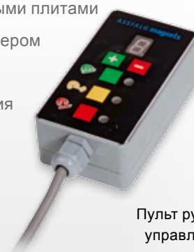
Пульт ручного управления