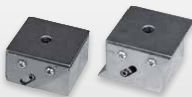
PVB в сжатом (слева) и разжатом (справа) состоянии