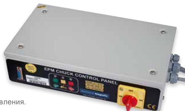
Блок управления D50

Каждый блок управления оснащен сетевым кабелем длиной 3 м для подключения к 400 В и кабелем длиной 3,5 м для каждого канала с байонетным разъемом.