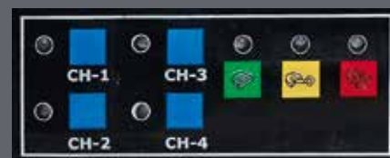
4-канальный пульт управления у D100-4